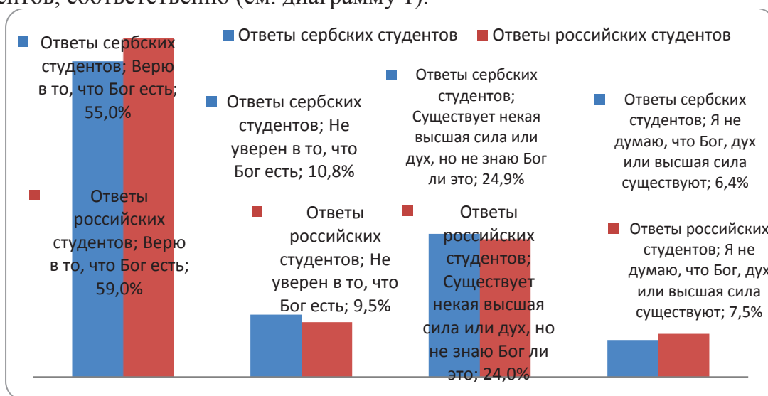
Диаграмма 1. «Вы верите в то, что Бог есть?»

1. В данной связи одним из ключевых вопросов, предложенных респондентам, был вопрос «Верят ли они в то, что Бог есть?». При ответе на данный вопрос выяснилось, что 59,0% российских респондентов верят в Бога, 24,0% – верят в то, что «существует высшая сила или дух, но не уверены, Бог ли это», и всего 9,5% ответивших «не уверены, что Бог есть». Что касается студентов Сербии, то среди них верят в Бога 55,0%; верят в то, что «существует высшая сила или дух, но не уверены, Бог ли это» 24,9%, и «не уверены, что Бог есть» 10,8% опрошенных. Не думают, что Бог, дух или высшая сила существуют, 6,4% и 9,3% российских и сербских студентов, соответственно (см. диаграмму 1).