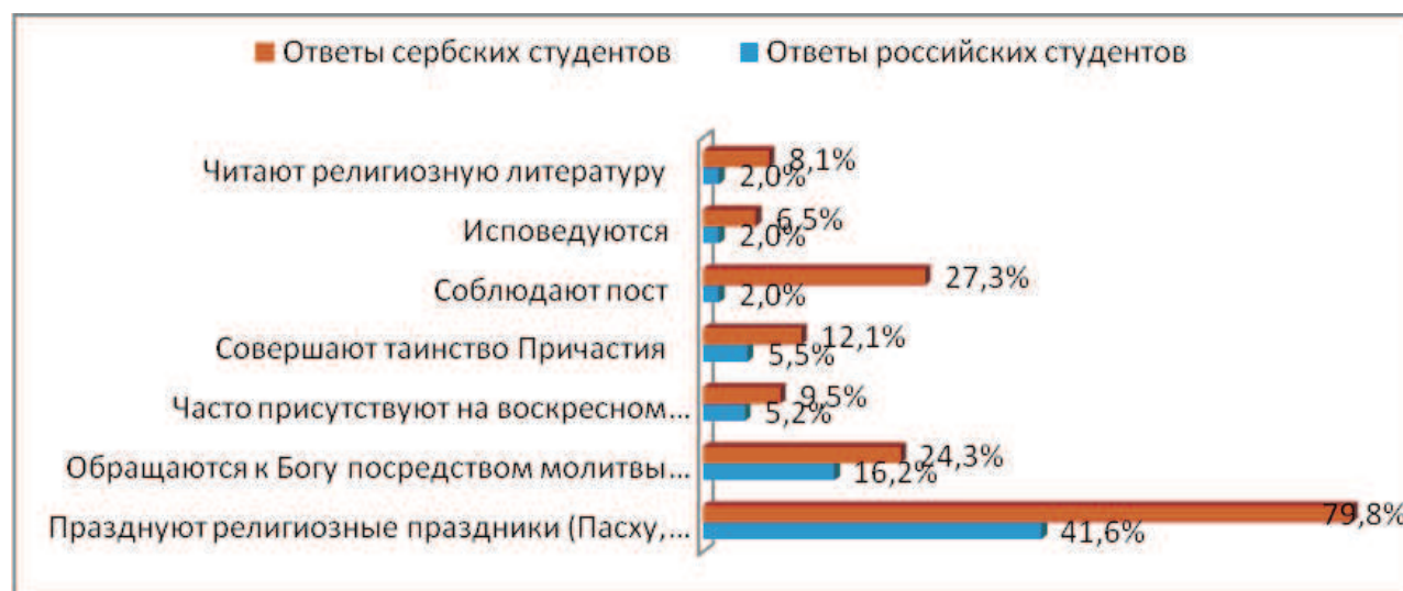
Диаграмма 3. «Как часто в Вашей жизни происходит...»

Что касается сербских студентов, то среди них празднуют религиозные праздники (Рождество, Пасху) часто 79,8%; часто обращаются к Богу посредством молитвы вне церкви 24,3%; часто присутствуют на воскресном богослужении 9,5%; часто совершают таинство Причастия (важнейшее для православных верующих) 12,1% опрошенных. Участвовали в церковном обряде похорон – отпевания усопших «часто» 52,4% и «иногда» еще 32,1% (последнее связано с более распространёнными в Сербии традиционными отношениями «большой семьи»). Наконец, соблюдают пост часто 27,3%, исповедуются духовнику часто 6,5%, участвуют в благотворительных акциях 8,6% и читают религиозную литературу 8,1% опрошенных сербских студентов (см. диаграмму 3).