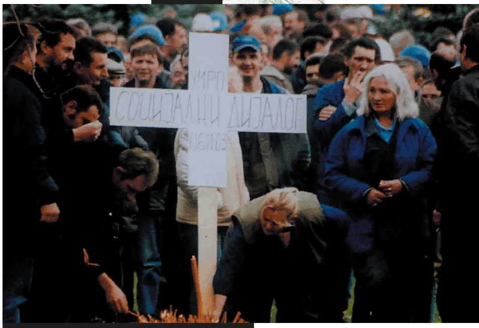
SLIKA 6. Sahrana socijalnog dijaloga, U.S.Steel, štrajk 2003.