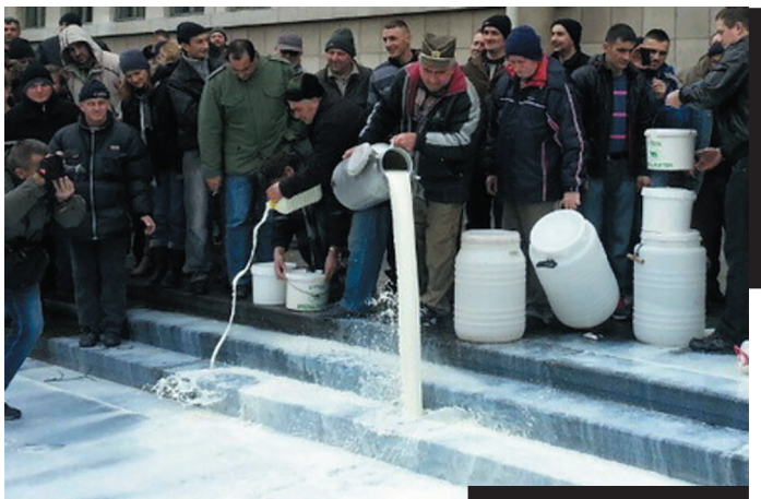
SLIKA 1. Mlekadžije, protest ispred zgrade Vlade Vojvodine (Kurir, 24. 02. 2009)