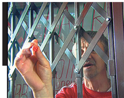
SLIKA 5. Štrajk glađu radnika kožare „Partizan« (Politika 20. 05. 2009)