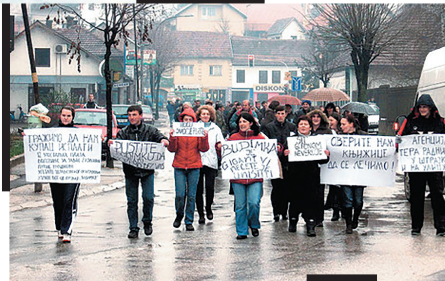
SLIKA 2. Budimka blokirala Požegu (Politika, 10. 12. 2009)