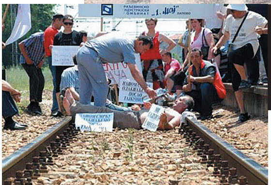
SLIKA 3. Radnici „1. maj« blokirali prugu u Lapovu (Sindikat Kragujevca, 24. 06. 2009)