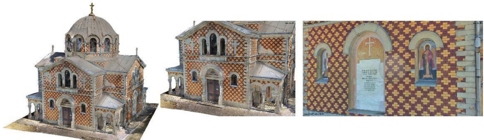
Слика 2: 3Д (меш) модел цркве добијен фотограметријском методом

Меш је геометријска структура која се користи за представљање и моделовање геопросторних облика и површина у тродимензионалном простору (Слика 2). Састоји се од мреже конектованих тачака, познатих као темена или врхови, и спољних ивица које их спајају. Ова структура омогућава представљање комплексних облика и површина у тродимензионалном геопростору и она игра битну улогу у анализи, визуелизацији и примени геопросторних података [3].