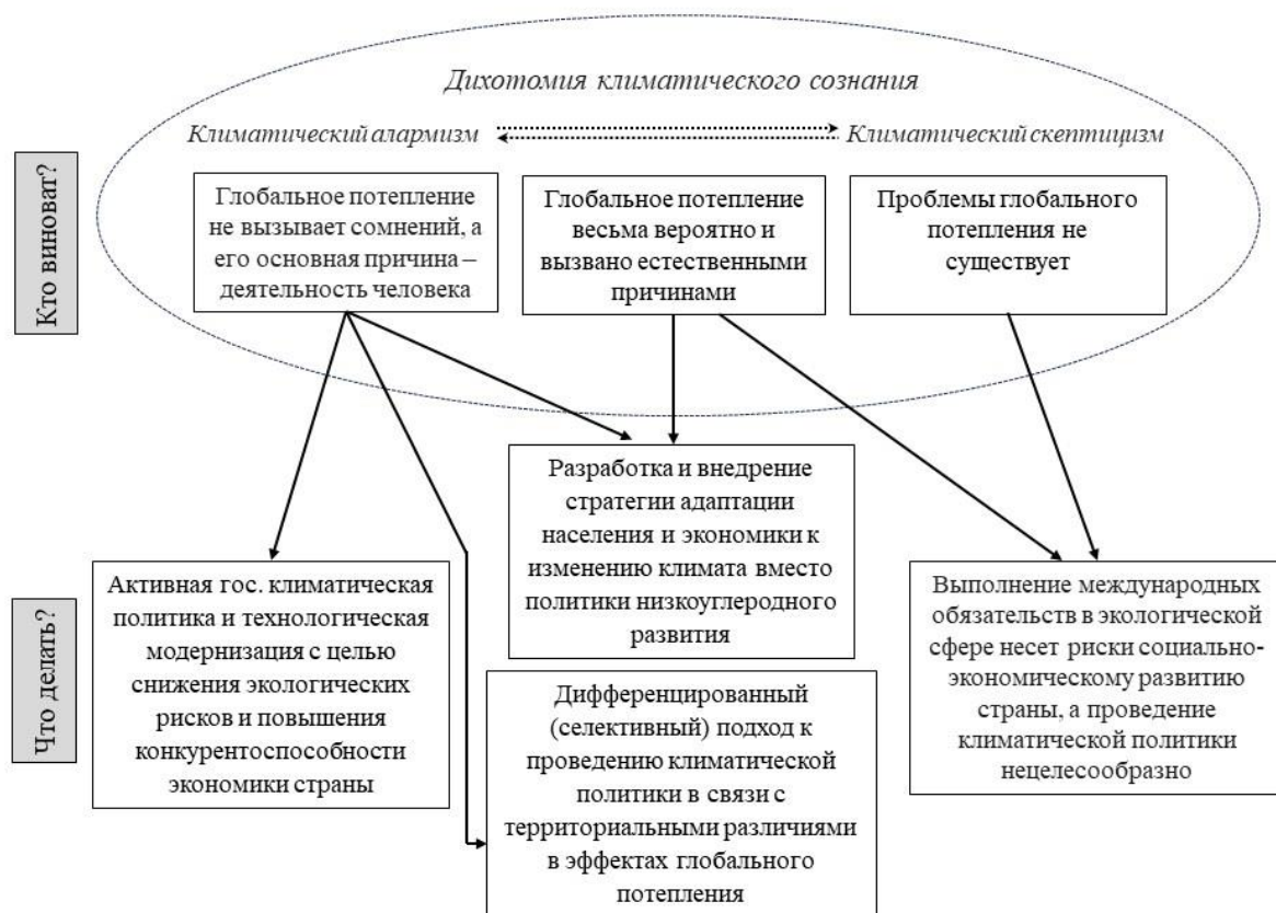
Рис. 2. Условная схема климатического дискурса в России

следователей феномена «парникового эффекта» сторонники теории антропогенного изменения климата всё же численно преобладают над приверженцами альтернативных концепций, связывающих глобальное потепление с изменениями наклона оси вращения Земли и солнечной активностью.